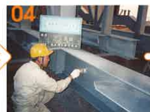
04 塗り厚検査 (ウェットゲージ使用1回目)