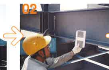
02 素地調整検査 (標準写真と対比)