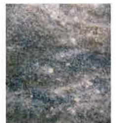
ZRC 77 \mu m