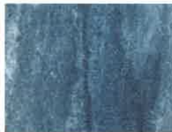
ZRC 100 \mu m