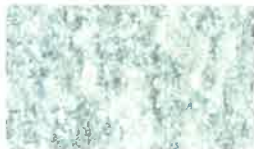
ZRC 77 \mu m