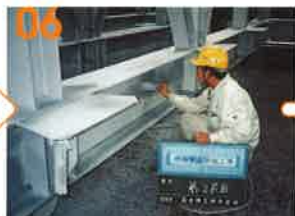
塗り厚検査 (ウェットゲージ使用2回目)