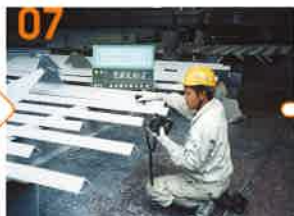
乾燥皮膜厚検査 (電磁膜厚計使用)