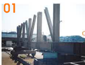
01 素地調整後 (プラスト後)